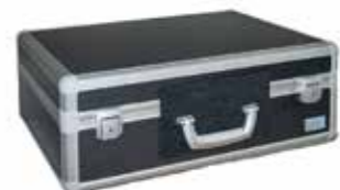
Transportkoffer // Transport case S / M