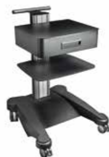
Ozon-Gerätewagen WEIKO // Ozone-Cart WEIKO